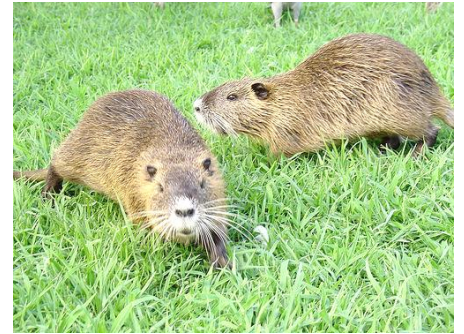
↑ 写真の動物がヌートリアです