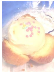
↑ 冷たいデザートでさっぱり☆