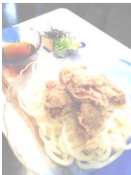
↑ 夏はやっぱり冷たい麺ですね♪

冷めん・冷やし肉うどん・冷やしかきあげうどん・冷やし唐揚 げうどん・ざるそば・ざるうどん・サーターアングァーアイス を食べて暑い夏を楽しみましょう♪